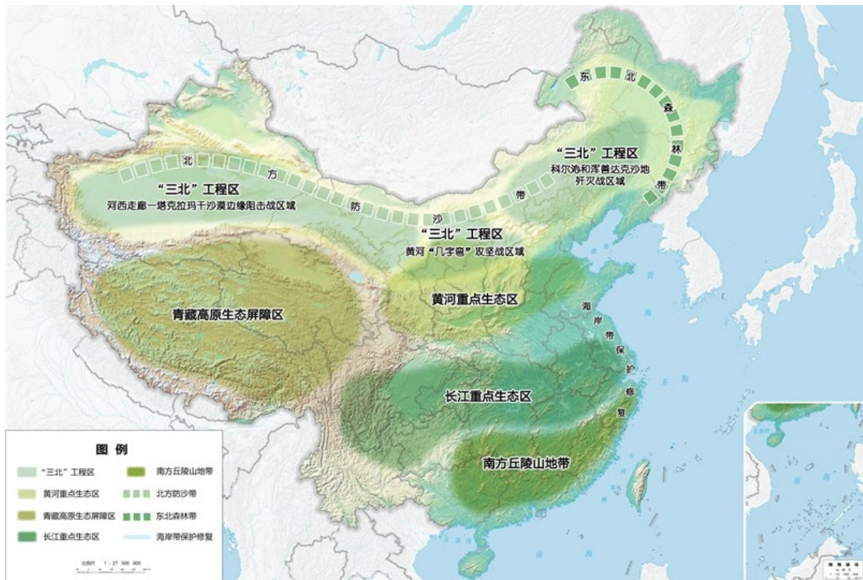
图3 重要生态系统保护和修复重大工程布局图