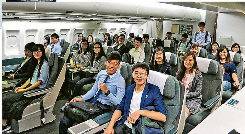
▶學生參加「航空實習計劃」，並參觀國泰航空公司。