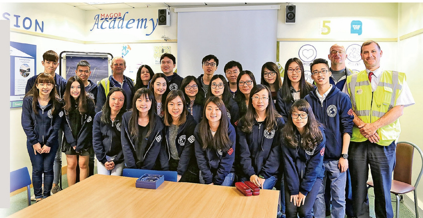
▲學生參加海外考察團到訪英國的公司，了解供應鏈與物流業的具體運作情況。

香港一直是全球供應鏈、物流與航運的重要樞紐，隨着未來機場第三條跑道、港珠澳大橋及大型物流設施陸續落成，人才需求有增無減，培訓更多高質素人才，以應付未來發展，是行業的當務之急。香港理工大學物流及航運學系開辦一系列的物流及航運課程，當中包括：政府資助的「全球供應鏈管理（榮譽）工商管理學士學位」、「國際航運及物流管理（榮譽）工商管理學士學位」及兩年全日制「航空管理及物流（榮譽）工商管理學士學位」銜接課程。以上課程均適合持有副學位或高級文憑，以及有志於國際供應鏈、物流與航運行業的學生報讀。