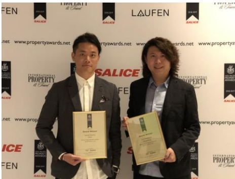
2018 年榮獲 Asia Pacific Property Awards

他們的設計亦逐漸在國際上屢獲殊榮，首次參加 International Property Awards，就以中環娛樂行英皇戲院及上海百麗宮影城兩個項目獲得亞太區獎項 - Asia Pacific Property Awards: Interior Design，其後亦曾分別得到意大利 A' Design Award and Competition 金獎、德國 Germany Design Award、倫敦 International Property Awards 和美國 The American Architecture Prize 等等。