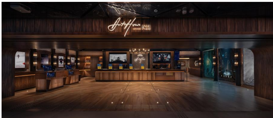
OFT Interiors Ltd 為 UA 新概念旗艦電影院 K11 Art House 做全新店面設計