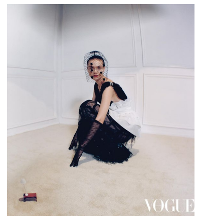
Winsome 參與《JUXTAPOSED 2020》時裝展覽，其作品刊登在時裝雜誌上。

Winsome成功創業，當然不單因為她那股一往無前的創業衝勁，也因為她那穩打穩紮的功夫，她擅於將歷史、文化和現實生活的色彩融合於時裝設計之中，獨樹一幟，是時裝設計界的奇葩，很受海外買家賞識。「莊周夢蝶」和「結」是她其中兩個備受歡迎又發人深思的系列，「莊周夢蝶」是希望港人可以學習莊子享受人生；而「結」是想傳達中國人代代緊密相連的情意結。她的作品曾入選多過