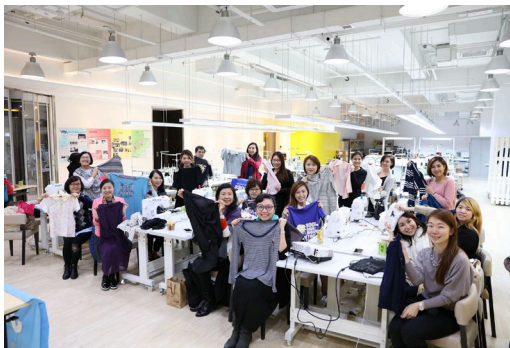
Winsome 在「裳樂匯坊」舉辦升級再造時尚服裝工作坊

國際設計獎項，曾經獲得匯豐營商新動力獎勵計劃的優異獎狀(2008)，並於日本電視台時裝比賽節目 Asian Ace 獲得設計冠軍(2012)，又曾入圍亞洲青年創作集錄 [APPortolio VOL.4]，成為其中一位跨越兩岸四地的亞洲代表，後來更獲邀請進駐 PMQ 成立品牌實體店。