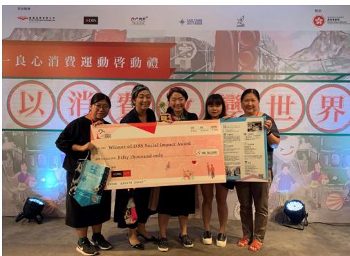
「裳樂匯坊」榮獲 DBS Social Impact Award 2019