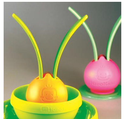
KidoKare 抗菌兒童餐具系列，為傳統企業升級轉型，提供品牌及產品設計顧問服務的成功案例。