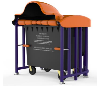
替本港漁農自然護理署設計的戶外垃圾桶(RollerFence)，有效防止野豬翻垃圾覓食。

時代變了，初心未改。儘管花巧、不切實際、盜版的產品充斥社會，他們仍然堅持原創，期望通過設計將生活、產業以致社會變得更加富足。儘管當下的學生各有個性，他們仍然有教無類，期望循循善誘之下，學生可以成材成器。