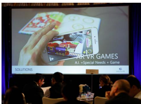
利用 AR 擴增實境技術的正面情緒教學書《快樂王國》，配合大學實證研究協助自閉症兒童學習情緒認知

創業從來不易，筆者幾番追問他創業六年以來，遇上甚麼困難和挑戰，他總是開懷地笑，一再強調「真的沒有什麼困難，也許是自己很幸運，一直以來都很順利。」但其實創業之初，他們推出的 AR 卡片，以失敗告終；其後推出的 3 至 4 個產品，市場反應仍然不佳。他生性樂觀，從沒有放在心上，「樂觀」其實是創業者必須具備的條件，只有「樂觀」，才可以迎難而上，屢敗屢戰。