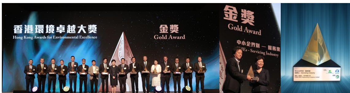
嘉信（香港）工程有限公司榮獲 2017 年香港環境卓越大獎（中小企界別服務業 - 金獎），由行政長官林鄭月娥頒發獎項，表揚他們積極實踐環境管理和對環保作出卓越的貢獻。

談到創業，Ricky 則提醒說：「其實有些人是不適宜創業的，這關乎個人的根本性格。有人天生是跟從者，並不適合當領袖。這是沒有貶意的，打工也可以很開心，各人有各人的生活取向。打工的有假期，想放假就可以放假；當老闆可不一樣，他們可沒有年假，即使放假，也可能需要遙距工作。但是，創業者可能會有不一樣的滿足感和鍛煉，如果天生沒有那種性格，當老闆便有點困難了。」