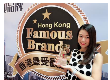
First Footprint 榮獲亞洲品牌發展協會頒發 2017 年「香港最受歡迎品牌」