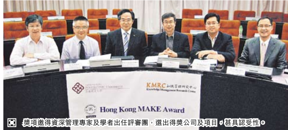
獎項獲得資深管理專家及學者出任評審團，選出得獎公司及項目，最具受性。

其他獲獎機構（排名按英文字母序） 大家樂集團有限公司 九龍巴士(1933)有限公司