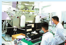
▲科研人員在理大實驗室嫦娥五號模型前研究相關實驗數據。

對容啟亮而言，他的科技夢是以知識協助推動國家的科技發展，並致力創新發明，為人們帶來裨益。「如果只看香港，眼光就狹窄了，一定要打開眼光，看外面，做出來的東西才能適用於更廣闊的環境，科研才會真的有用。」容啟亮希望香港的青年科研人才不被「困」在香港，而是在一個更大的範圍，做真正對人類有建設的研究。