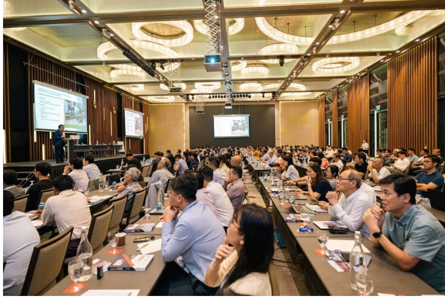
第三届钢结构与组合结构进展国际会议