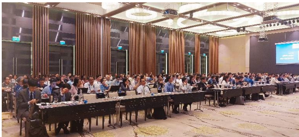
约 250 名设计及建造工程师出席本次国际会议