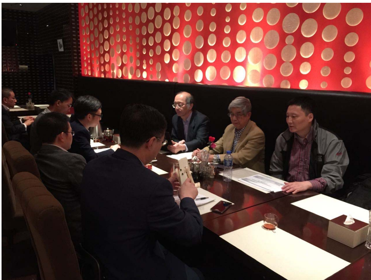
香港理工大学代表、西南交通大学代表在铁路总公司进行工作汇报。摄於中国铁路总公司总部