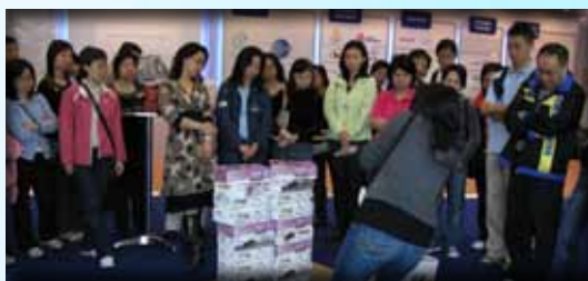
學員有機會參與考察活動。

學員通過交流切磋，了解各行業之經貿法規和市場運作，同時亦有助學員厚植各方人脈，搭建未來相互橋樑。