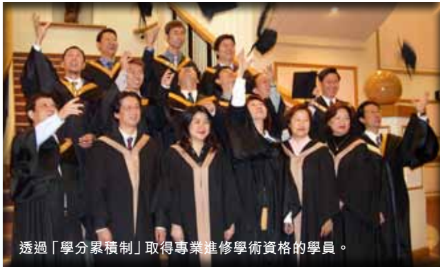
透過「學分累積制」取得專業進修學術資格的學員。

「學分累積制」(Credit Accumulation Mechanism) 是香港理工大學專業進修學院 (SPEED) 一個非常靈活及富彈性的學習制度。學員可根據自己的興趣、時間及學習進度釐定進修計劃。在完成個別單元課程及成功通過評核後，學員可獲取學分，累積至足夠學分，可獲頒發香港理工大學專業進修學院的專業進修學術資格，包括：學士、副學士、專業進修文憑或專業進修證書。