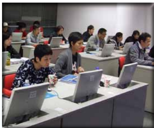
透過最新教學軟件，學員可以應用課堂學到的理論。

學員在修讀期間可使用香港理工大學包玉剛圖書館及借閱企業經管人才發展中心 (MEDC) 提供的各類參考書籍。