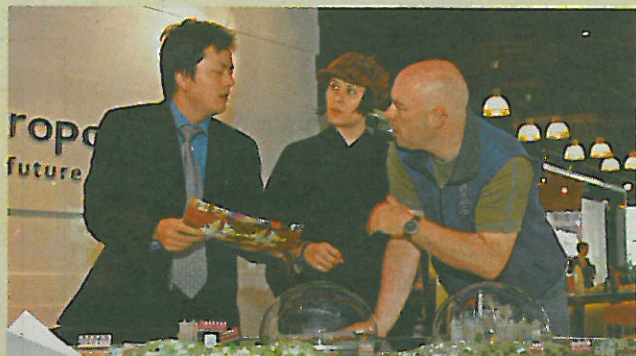
香港是國際城市，每一個行業均需要以英語溝通。(資料圖片)

課程要求學生具備最少兩年工作經驗，以在課堂討論等方面更有得着。Prof. Warren謂：「課程名為『專業英語』，旨在幫助在不同專業工作的人士，提高英文水平。學生間的互動和彼此學習也非常重要，